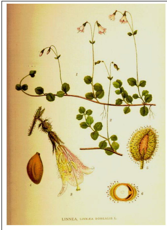
1. Liggjande stengel med kortskot og blomar . 2: Her er blomen blitt til frukt. 3: Lengdesnitt av blom. 4: Nøtt (frukt) 5: Nøtt med spreingsapparat av to kjertelhåra skjermblad som festar seg i pelsen til dyr. 6: Tverrsnitt av nøtt med kjertelhår og skjermblad .